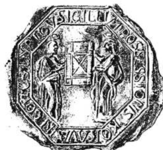
Pečať zo začiatku 18. storočia