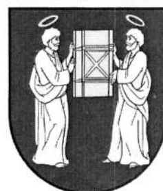
LIPTOVSKÁ KOKAVA /LM/