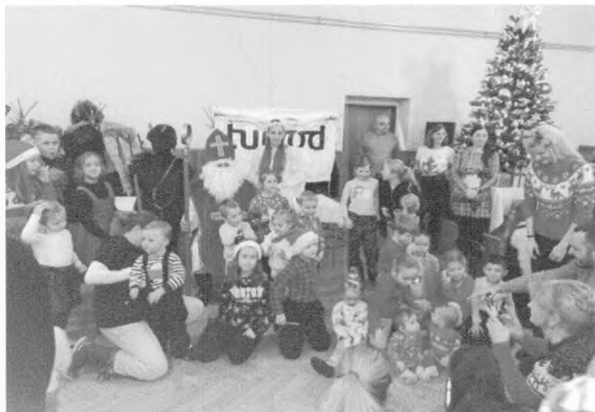
Posedenie s Mikulášom