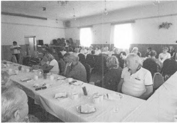
Posedenie s dôchodcami