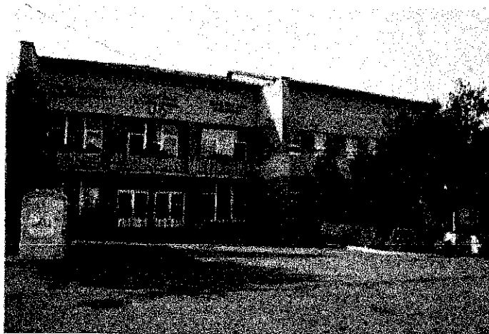
KOSTOL SV. ŠTEFANA KRÁĽA A KULTÚRNY DOM V BISKUPICIACH