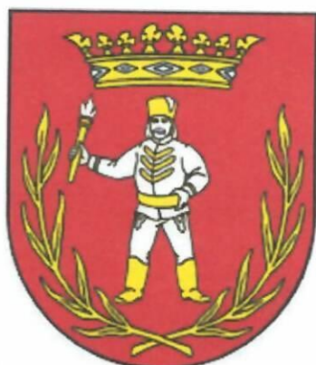
Erb obce :