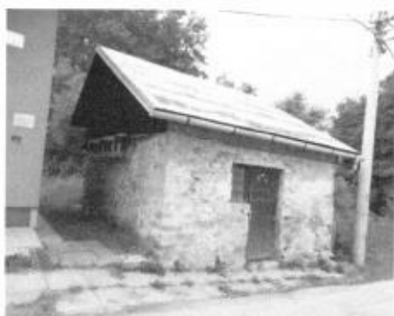
Pozostatky gazdovskej drevenej usadlosti - oplotenie