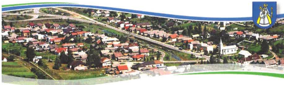
Pohľad na Ľubotín