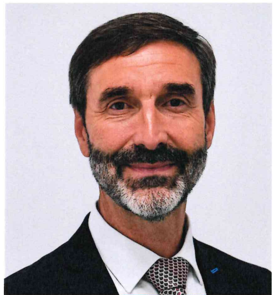
Juraj Blanár minister zahraničných vecí a európskych záležitostí Slovenskej republiky