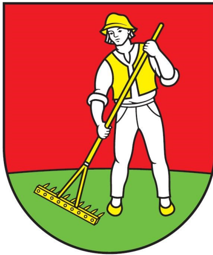
OBEC VYŠNÁ POLIANKA

Erb obce: V červenom štíte v zelenej pažiti striebro odetý muž v zlatej veste, zlatých topánkach a v zlatom klobúku držiaci zlaté ľavošikmo sklonené hrable.