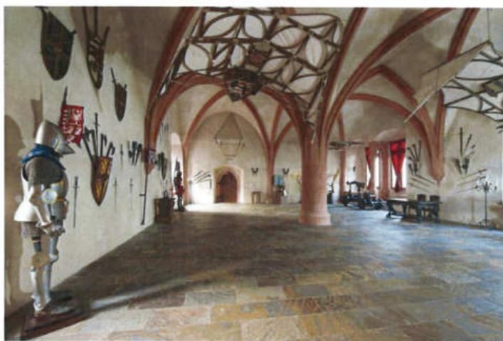
Obrázok 2: Velká rytierska sála

Veľmi obľúbeným priestorom je aj nočný Dragon bar , kde si naši hostia môžu užiť pokojný večer pri pohárikú kvalitného koňaku alebo vychutnať cigary svetových značiek.