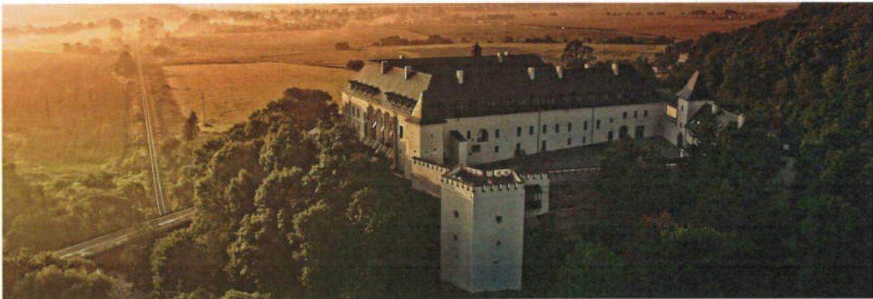
Obrázok 1: Hotel Grand Víglaš****

História Zámku siaha do 13. storočia, kedy bol kláštorným objektom. Na Zámku sa vystriedali viacerí panovníci ako Žigmund Luxemburský, Matej Korvín a ďalší. Zámok bol počas 2. svetovej vojny poškodený a z veľkej časti vyhorel. V roku 2007 zručaniny Zámku odkúpila spoločnosť Zámok Víglaš s.r.o., ktorá začala, pod dohľadom odborníkov z pamiatkových úradov, realizovať projekt ich obnovy, ktorý bol spolufinancovaný zo zdrojov Európskej únie.