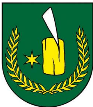
Obrázok 3 Erb obce Klin nad Bodrogom