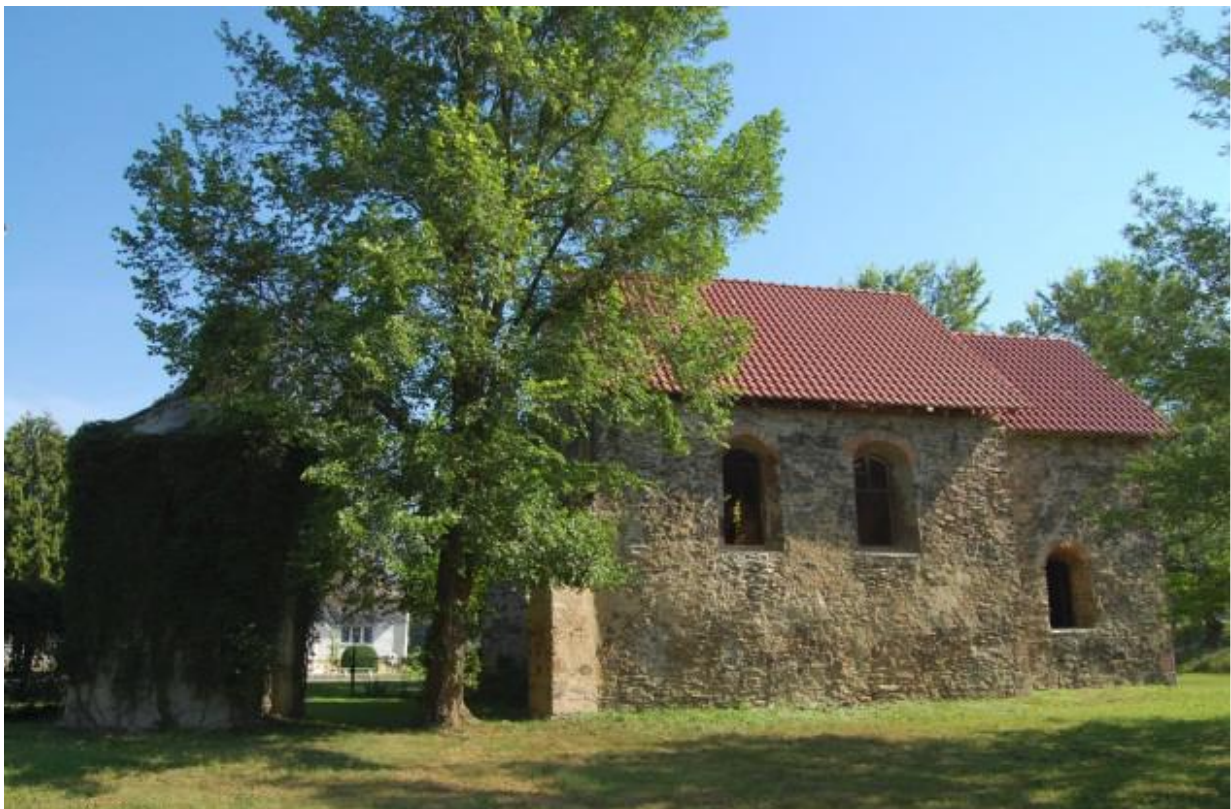
Obrázok 6 Rímsko-katolícky kostol po rekonštrukcii

Kostol od roku 2004 prešiel vďaka finančnej podpore Ministerstva kultúry Slovenskej republiky a spolufinancovaniu obce mnohými stavebnými úpravami.