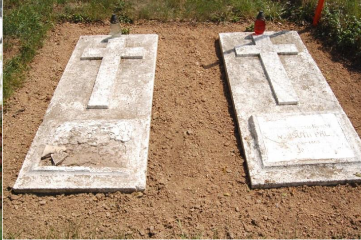
Obrázok 8 Hrobka rodiny Pavla Kossutha