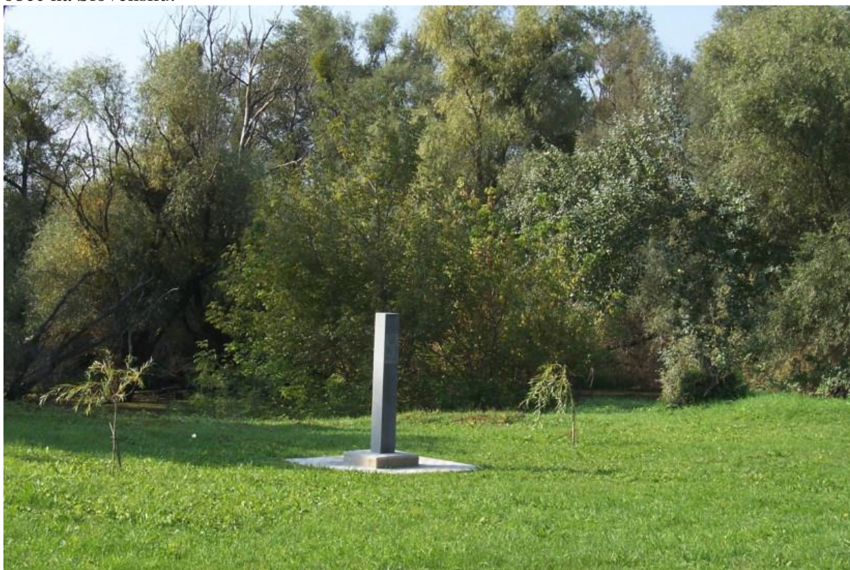
Obrázok 2 Najnižšie položené miesto na Slovensku (94,3 m n. m.)

Nadmorská výška v strede obce je 98 m n. m., v chotári 94 – 273 m n. m., ide o najnižšie položenú obec na Slovensku.