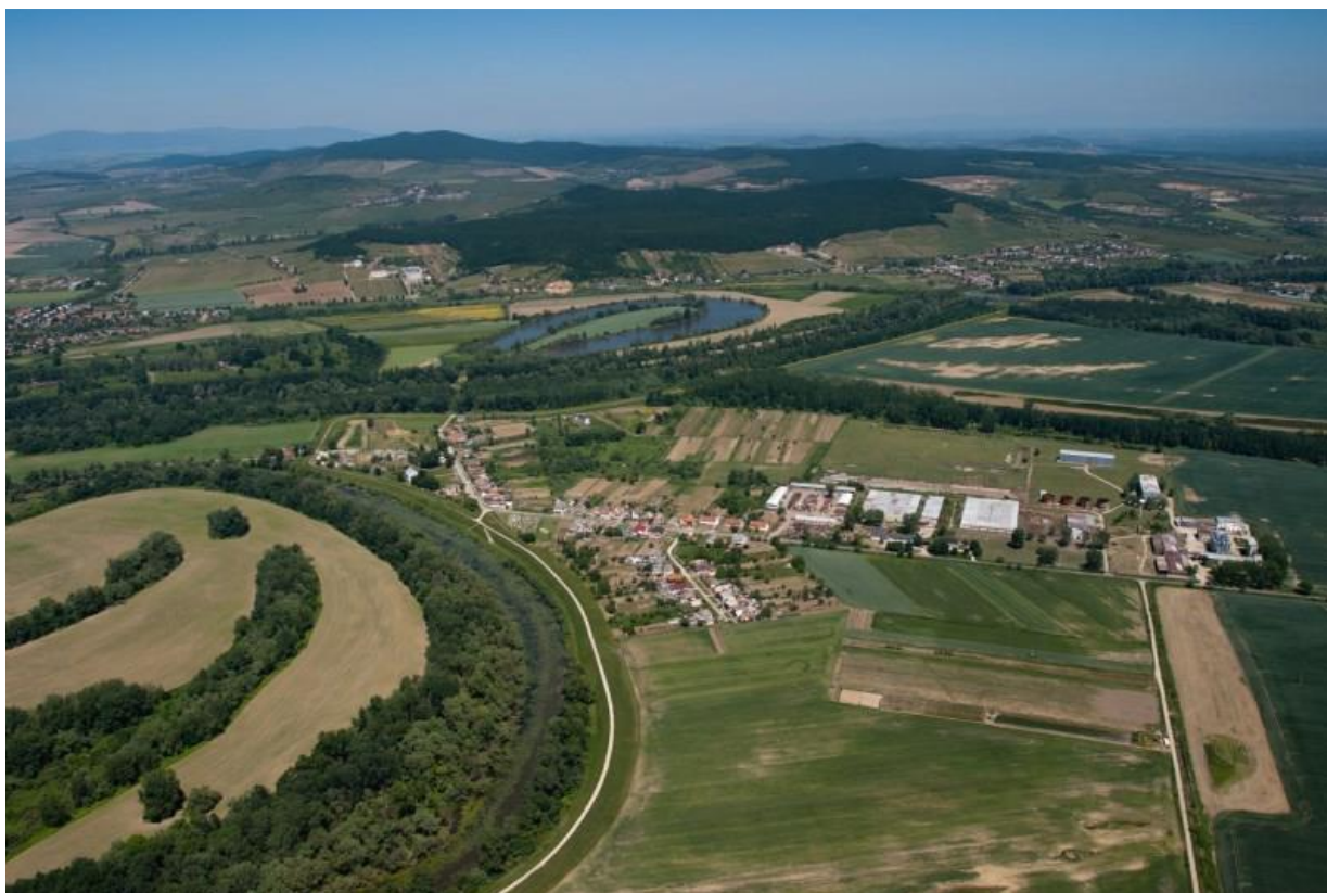
Obrázok 1 Pohľad na Obec Klin nad Bodrogom

Nadmorská výška v strede obce je 98 m n. m., v chotári 94 – 273 m n. m., ide o najnižšie položenú obec na Slovensku.