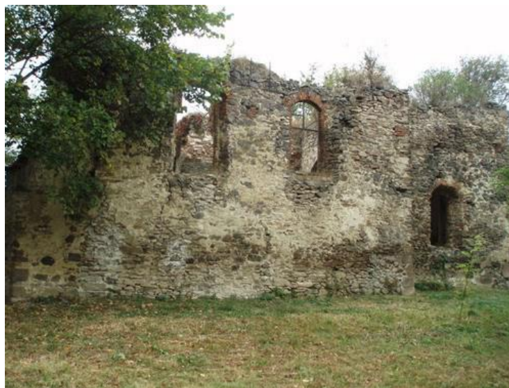
Obrázok 5 Rímsko-katolícky kostol Zjavenia Pána v Kline nad Bodrogom

Najvýznamnejšou kultúrnou pamiatkou je Rímsko-katolícky kostol Zjavenia Pána, ktorý je najnižšie postavenou cirkevnou stavbou na Slovensku. Ide o torzo jednodňovej gotickej stavby s pravouhlým ukončením presbytéria, bez veže z tretej tretiny 13. storočia.