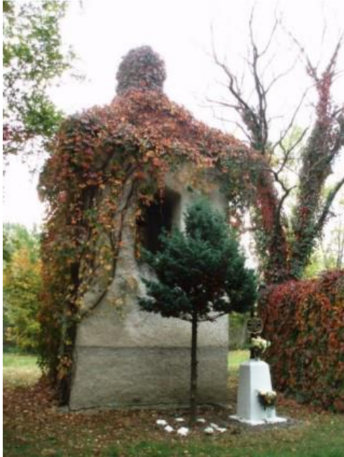
Obrázok 7 Zvonička

Pri kostole stojí jednoduchá murovaná zvonica na pôdoryse štvorca so segmentovo V areáli terajšieho obecného úradu sa nachádza hrobka zemepánov Kossuthovcov.