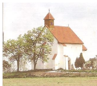
Kostol sv. Filipa a sv. Jakuba