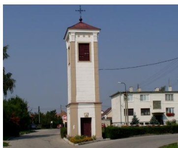
Zvonica Dedinka pri Dunaji