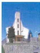
Kostol Krista Kráľa