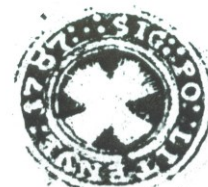
pečať z roku 1787