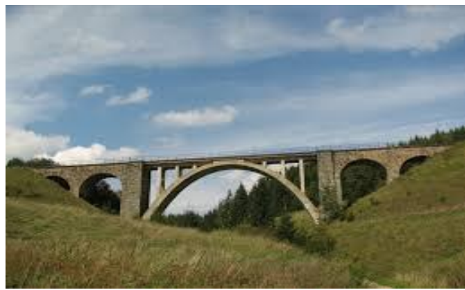
Telgártsky viadukt – súčasť Telgártskej slučky