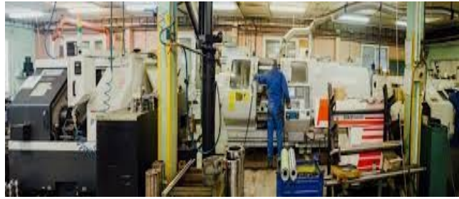
Slovacom výroba okien