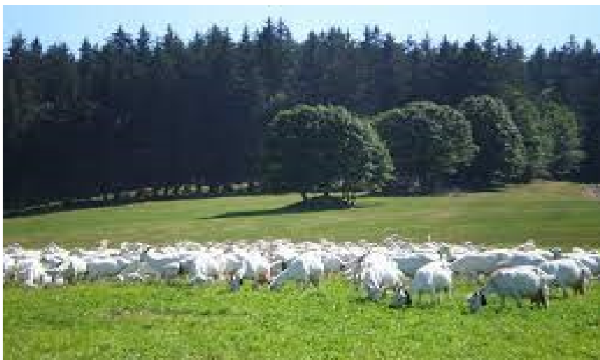
Kozia farma Abel plus