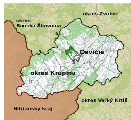
Mapa 1: Geografická poloha obce Devičie

Vzhľadom k tomu, že obec je otvorenou ekonomickou a sociálnou jednotkou s väzbami na svoje okolie je dôležité, kde sa v tomto priestore nachádza.