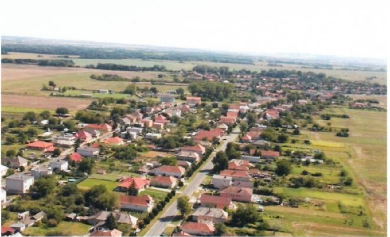
Letecký pohľad na obec Lipová

Od roku 1998 má obec samostatnú farnosť.