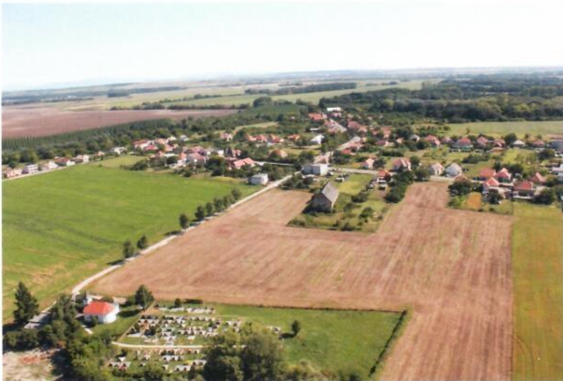
Letecký pohľad na obec Lipová