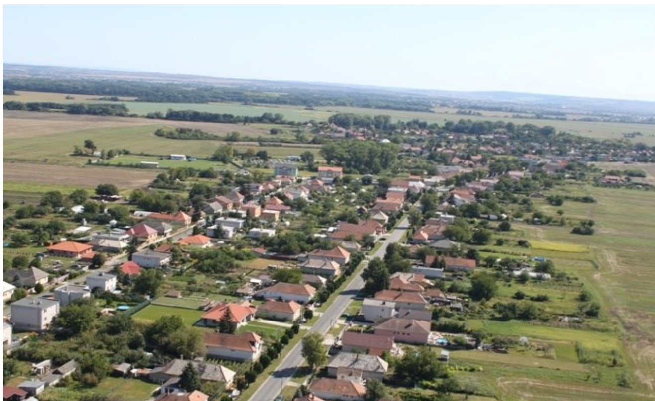
Letecký pohľad na obec Lipová

Od roku 1998 má obec samostatnú farnosť.