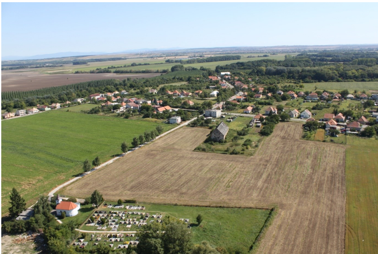
Letecký pohľad na obec Lipovú