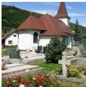
Rímskokatolícky kostol Navštívenia Panny Márie s drevenou plastikou z druhej polovice 15. storočia