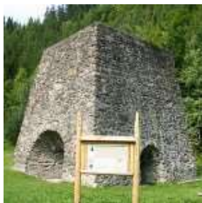
Vysoká pec v časti Tri Vody

Obec Osrbliie sa môže pochváliť pamiatkami: