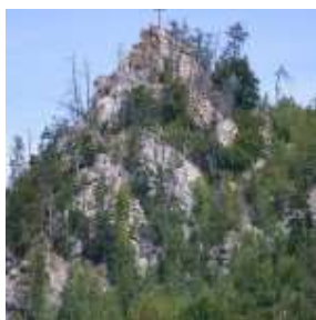
Križ postavený po kalamite v roku 1996 na Štompovej skale