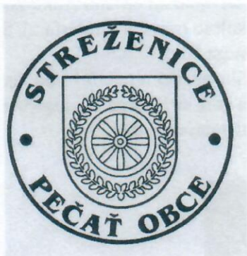
Obecná pečať s kruhopolisom

Pečať obce je okrúhla, uprostred s obecným symbolom a kruhopolisom OBEC STREŽENICE s priemerom 35 mm.