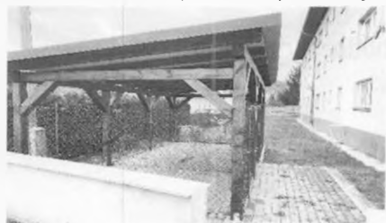
pri BD 1310