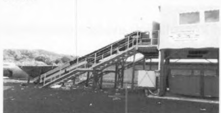
Linka – šikmý dopravník