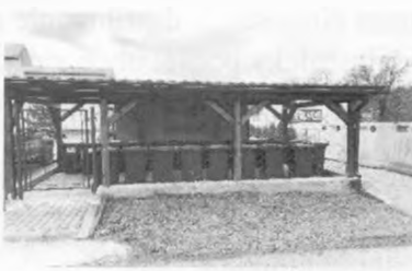
pri ObZS a BD 1370