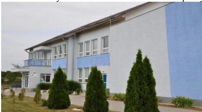
Základná škola Juraja Holčeka

V súčasnosti výchovu a vzdelávanie detí v obci poskytuje: