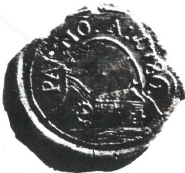
Pečat' z roku 1786