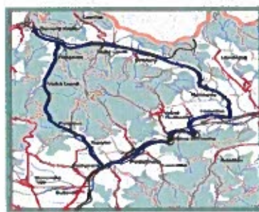
Obrázok č. 3

Toporec je potočnou radovou dedinou. Dominantu obce tvoria katolícky a evanjelický kostol a dva kaštiele Górgeyovcov. Stredom obce preteká potok Topor, od ktorého je odvodené aj pomenovanie obce. Podľa súčasného územnosprávneho členenia patrí obec do okresu Kežmarok. Chotár Toporca hraničí na juhozápade s Podhoranmi, Vojňanmi a Slovenskou Vsou, na severe s Veľkou Lesnou a Veľkým Lipníkom, na východe s Vyšnými Ružbachmi a Podolíncom a na juhu s Holumnicou. Chotár je kopcovitý v nadmorskej výške 600-750 m. Zvláštnosťou chotára boli početné pramene kyseliek, ktoré obyvatelia veľmi radi pili.