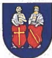
Obrázok č. 4

Erb obce: v modrom štíte dva červené štíty, v prvom zlatý kríž, v druhom zlatý súkenický slák, za štítmi sú ako nosiči strieborní zlatovlasí sv. Filip a sv. Jakub ml., každý drží na hrudi zlatú knihu.