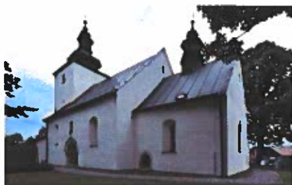
Obrázok č. 6

Sakrálny objekt bol vybudovaný na menšej vyvýšenine (573 m n. m.) zarovnanej terasy Toporeckého potoka, na južnom okraji Spišskej Magury. Stavba vznikla v rámci významného