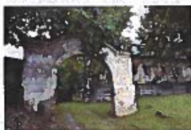
Obrázok č. 9

Presné údaje o tom, kedy bol Toporecký kaštieľ postavený nie sú známe, ale vyplývajú z faktov, že Toporec bol od prelomu 13./14. stor. sídlom rodu Gőrgeyovcov, je možné predpokladať, že najstaršia časť kaštieľa mohla pochádzať ešte zo začiatku 14. stor. Postupný stavebný vývoj kaštieľa nie je doposiaľ známy, nakoľko sa na objekte neuskutočnil archeologicko-architektonický výskum, ktorý by pomohol odhaliť dejiny objektu.