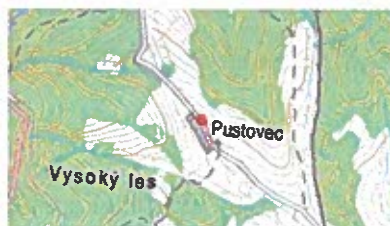
Obrázok č. 11

V miestnom kostole na ich rodinnom erbe z prvej polovice 17. storočia je vyobrazený symbol - lipový strom.