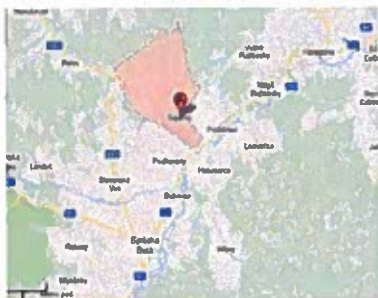
Obrázok č. 2

Obec leží na južnom úpätí Spišskej Magury, vzdialená asi 2 km od rázcestia do Podolínce v 6 km dlhom údolí, ktoré sa tiahne od rázcestia, kde je zastávka železničnej trate, na sever; cesta vedie ďalej cez sedlo Javor do Veľkej Lesnej a do Červeného Kláštora. Je to najkratšie spojenie z údolia Popradu do údolia Dunajca. Celková rozloha obce je 28,12 km 2 .