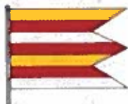
Obrázok č. 5

pozostáva zo siedmich pozdĺžnych pruhov vo farbách žltej, červenej, bielej, červenej, žltej, červenej a bielej. Vlajka je ukončená tromi cípmi.