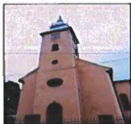
Obrázok č. 7

V súčasnosti sa jedenkrát do roka v kostole konajú Služby Božie za účasti evanjelických veriacich z okolitých obcí a potomkov bývalých nemeckých občanov obce.