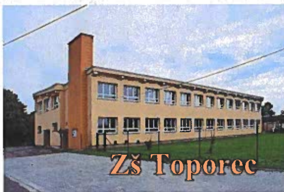
Obrázok č 12

➤ Základná škola Toporec, Školská 7/6, 059 95 Toporec