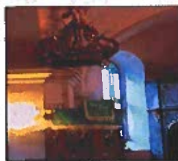
Obrázok č. 8