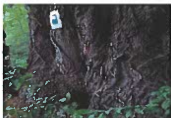
Obrázok č. 10

Pri majeri Pustovec sa nachádza chránený strom – lipa veľkolistá ( Tilia platyphyllos scap.) s výškou 33 m, s obvodom 786 cm, korunou 20 m. Jej vek sa odhaduje na 550 rokov. Na rozdiel od väčšiny iných, starších líp na Slovensku, z ktorých sú už len dožívajúce torzá, lipa na Pustoveci je v dobrej kondícii. Je jednou z troch líp, ktoré údajne vysadili traja synovia rodiny Görgeyovcov.