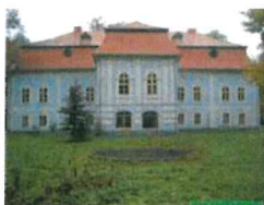
Stav v roku 2002

Dátum vzniku tohto kaštieľa nie je presne známy, z hľadiska stavebného vývoja a slohového zaradenia sa jedná o budovu, ktorá vznikla zo staršej renesančnej stavby, datovanej do 17. storočia, prestavanej a prefasádovanej v 2. polovici 18. storočia do dnešnej barokovo-klasticistickej podoby.