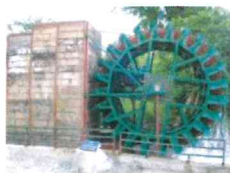
Prvá obecná vodná elektrárň na Slovensku v Necpaloch

- Obec Necpaly má funkčnú prvú obecnú vodnú elektrárň na Slovensku. Spustená do skúšobnej prevádzky bola 19.7.2007.