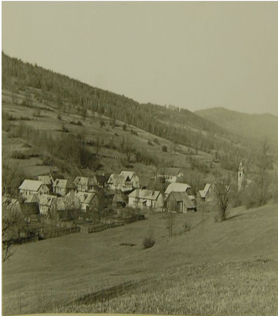
Obrázok 2 Obec v období 50-tych rokov

Do okolitých obcí ľudia v tom čase chodili pešo alebo na vozoch. To sa však začalo meniť od roku 1951, kedy do obce zavítal prvý autobus. V roku 1954 bol na policajnej stanici namontovaný prvý telefón, ktorý slúžil aj občanom obce a vďaka nemu bolo možné včas zavolať doktora či sanitku. Ďalší zlom nastal 10.10.1959, kedy bol do obce zavedený elektrický prúd. V tom istom roku bola v obci zriadená pošta, ktorá sídlila v školskej budove a neskôr v rodinnom dome. V roku 1968 sa začala rekonštrukcia vojnou poškodeného gréckokatolíckeho chrámu postaveného v roku 1937. Rekonštrukčné práce boli dokončené v roku 1971.