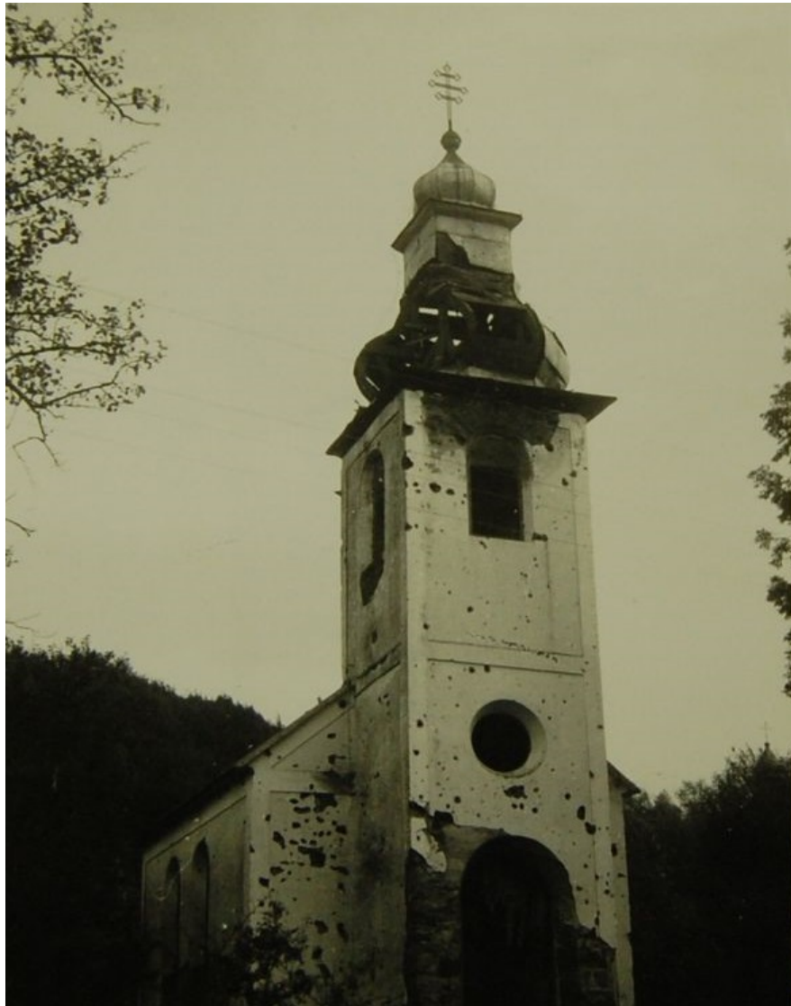
Obrázok 1 Vojnou zničený gréckokatolícky chrám sv. veľkomočenika Dimitrija Solúnskeho