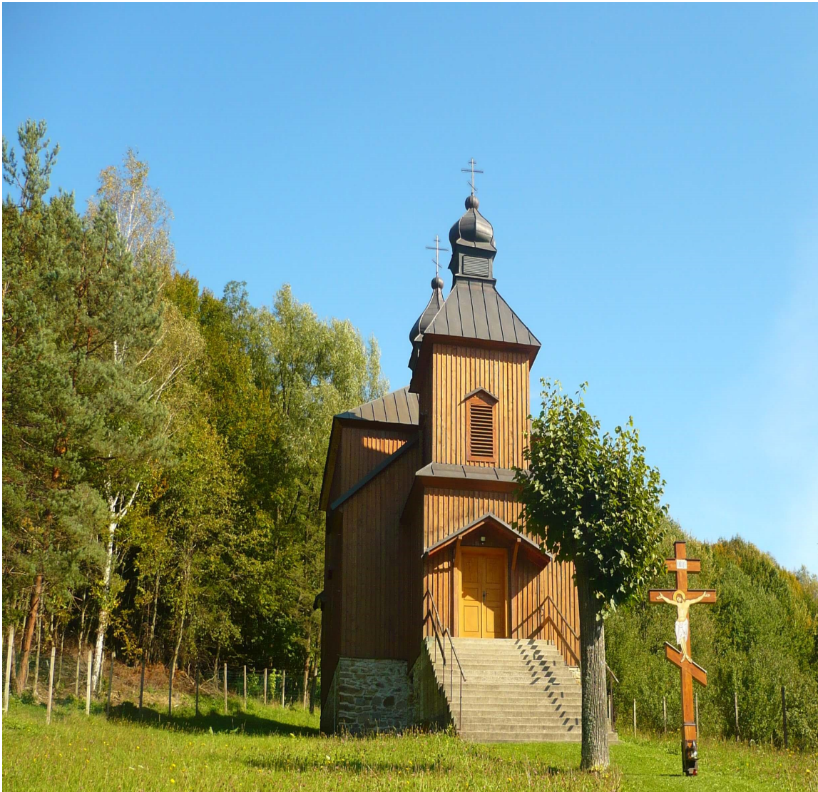
Obrázok 3 Pravoslávny chrám sv. veľkomučenika Dimitrija Solúnskeho

Ďalším menej známym a navštevovaným miestom je vojnové pohrebisko z 1. svetovej vojny, ktoré sa nachádza na obecnom cintoríne. Pohrebisko bolo zriadené v roku 1922 po vykonaných exhumáciách a tvorí ho 43 hrobových miest. V 38 hroboch je pochovaných 58 príslušníkov 10. jazdeckej divízie 3. cárskej ruskej armády, ktorí na území obce viedli, po prekročení štátnej hranice a karpatských hrebeňov, od septembra 1914 do apríla 1915 bojovú činnosť. V ďalších 5 masových hroboch sú uložené ostatky 58 neidentifikovateľných tiel. Pohrebisko je označené iba pamätným dreveným krížom.