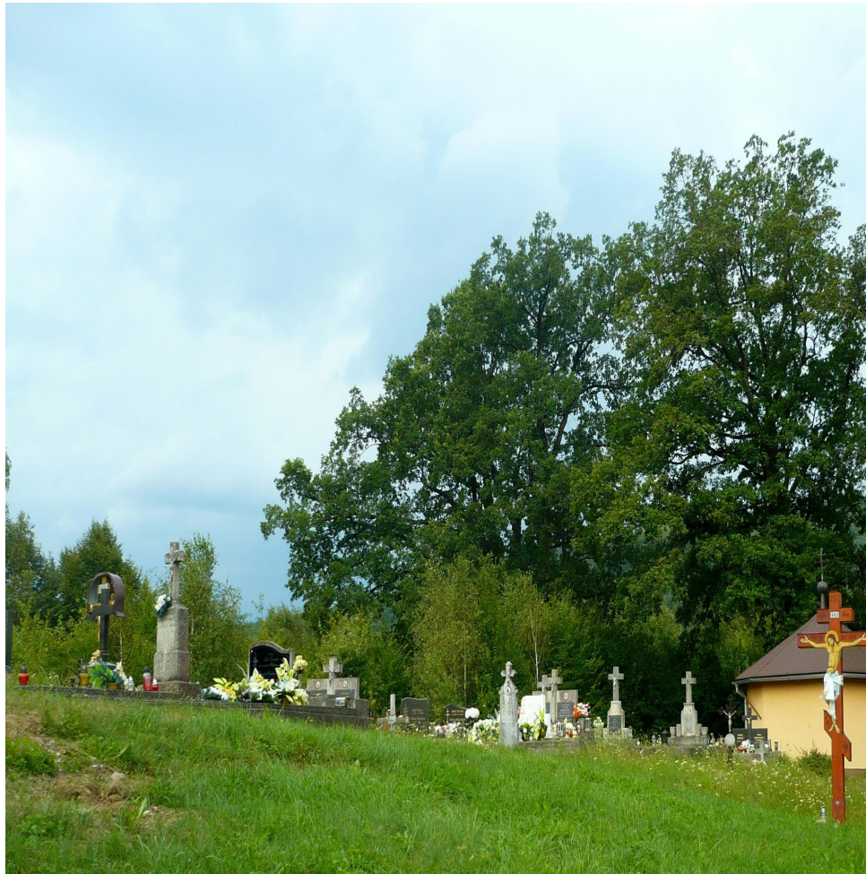
Obrázok 4 Vojnové pohrebisko z 1. svetovej vojny