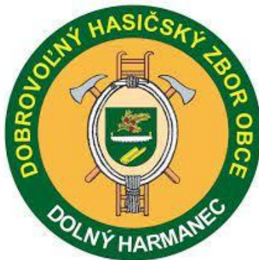
DHZO Dolný Harmanec