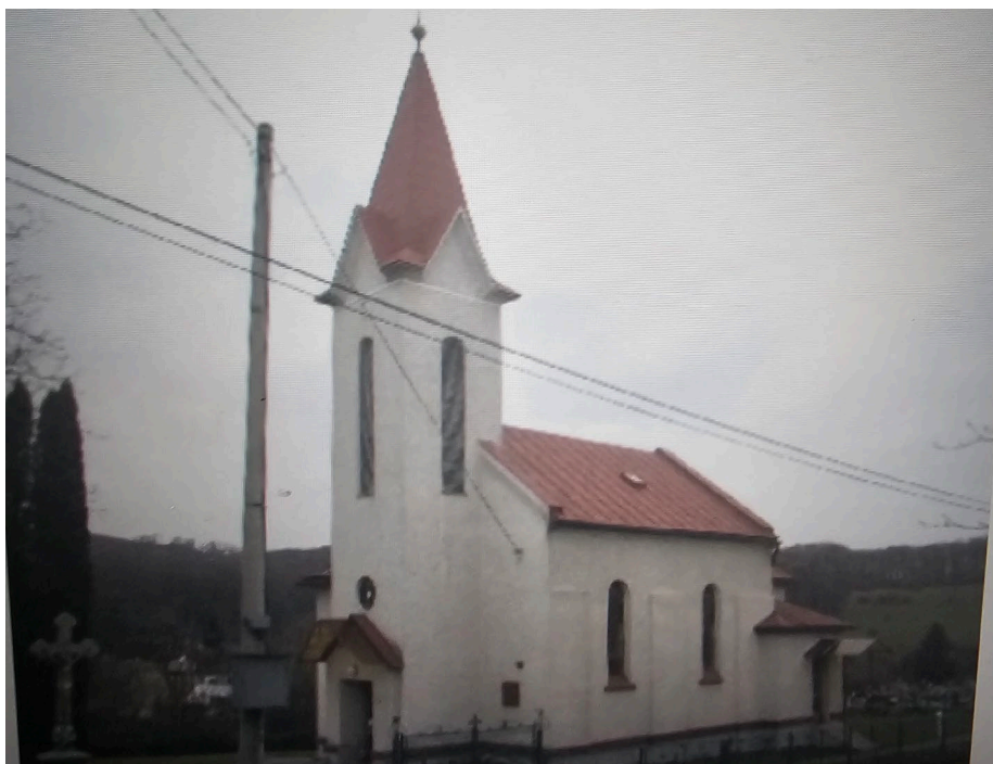
Rímsko-katolícky kostol "Nanebovstúpenia Pána"

V roku 1914 sa začal v obci stavať rímsko-katolícky kostol "Nanebovstúpenia Pána". Po vypuknutí 1. sv. vojny bola práca prerušená, lebo muži narukovali do armády a tak sa kostol dokončil až v roku 1936.