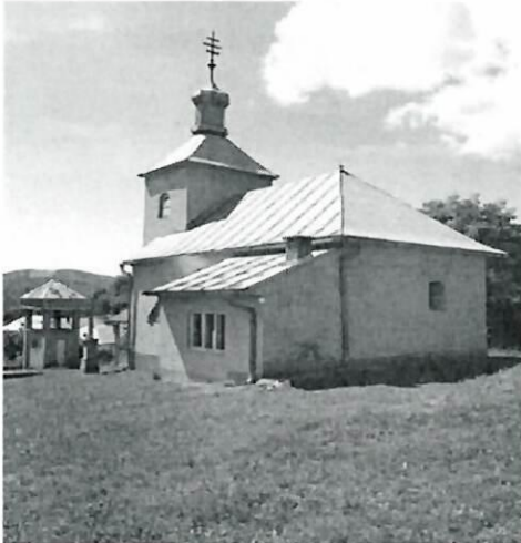
Dedačov - Narodenie Presvatej Bohorodičky, 1800

Gréckokatolícky Chrám narodenia presvätej Bohorodičky, jednolod'ová barokovo-klasicistická stavba s pravouhlým ukončením presbytéria a predstavanou vežou, z roku 1800. Obnovou prešiel v roku 1901. Presbytérium je zaklenuté valenou klenbou s lunetami, loď je plochostropá.