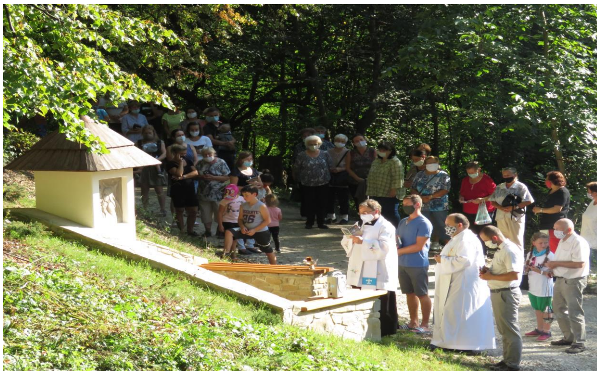
Cesta 7 radostí a 7 bolestí Panny Márie