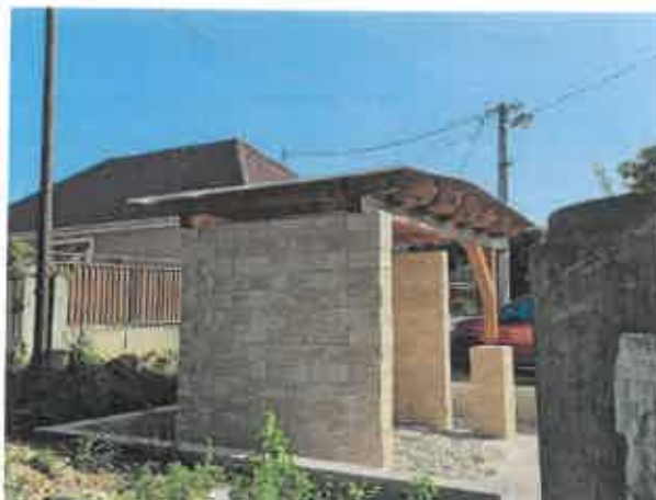
f) nové autobusové zastávky v obci