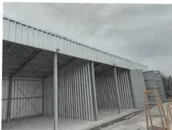
g) zberný dvor - stavba z projektu