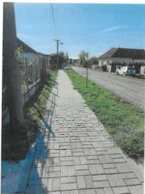
e) časť vybud. chodníka na ul. Mlynskej