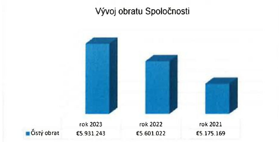
Graf č. 3: Vývoj obratu Spoločnosti za obdobie rokov 2021 – 2023

Údaje uvedené za jednotlivé obdobia vychádzajú z údajov uvedených v účtovných výkazoch (v stĺpci bežné účtovné obdobie), ktoré boli súčasťou účtovných závierok auditovaných k 31.12.2023, 31.12.2022 a 31.12.2021.