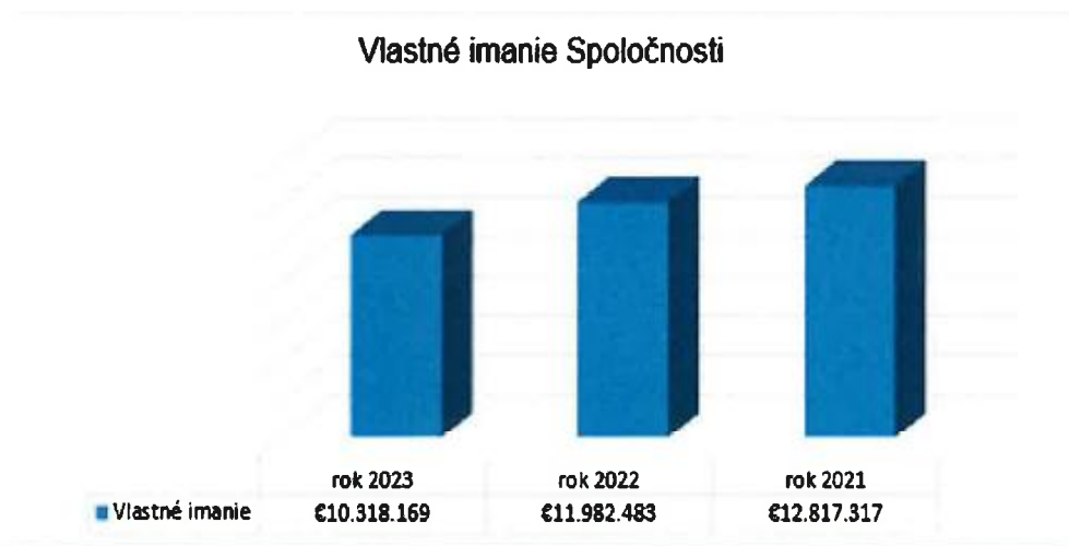
Graf č. 2: Vývoj vlastného imania Spoločnosti za obdobie rokov 2021 – 2023