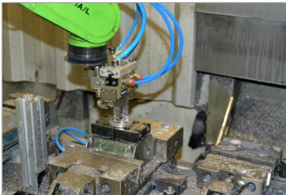
Robot podáva a odoberá kusy, čím sa zrýchľuje a zefektívňuje celý proces frézovania