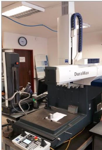
3D TOUCH PROBE, CMM, Zeiss, využívaný na kontrolu výrobkov

Unikátne technologické riešenia, vysoká profesionalita inžinierov a spolupráca so svetovými lídrami vo výrobe obrábacích nástrojov umožňuje dosahovať mikrónové presnosti pri opracovaní státisícových sérii výrobkov. Rozsah obrábaných výrobkov je od 1 g do 100 kg, rozmerovo od 1 mm do 1000 mm. Z hľadiska sériovosti od 1 kusa po 10 miliónov kusov, pričom viac druhov výrobkov je vyrábaných súbežne.