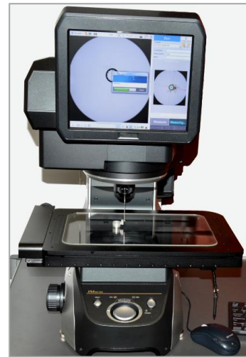
2D LIGHT TOUCH PROBE, Keyence, povyžívaný na kontrolu výrobkov

Firma má možnosť kontrolovať kvalitu obrobených výrobkov s presnosťou na 1 mikrón ( \mu\text{m} ), pričom to dokáže vykonať priamo v sériovej výrobe. CNC stroje s vysokou presnosťou a automatickou korekciou parametrov obrábania umožňujú dosahovať maximálnu stabilitu procesu obrábania.