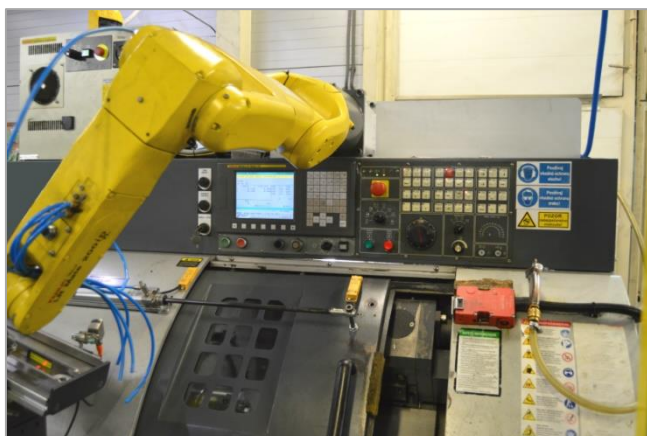
Robotizované pracoviská sú rovnako súčasťou sústruhov

Spoločnosť Global Industrial Parts , s.r.o. zároveň výrazne investuje do automatizácie a robotizácie svojej výroby v zmysle Industry 4.0.