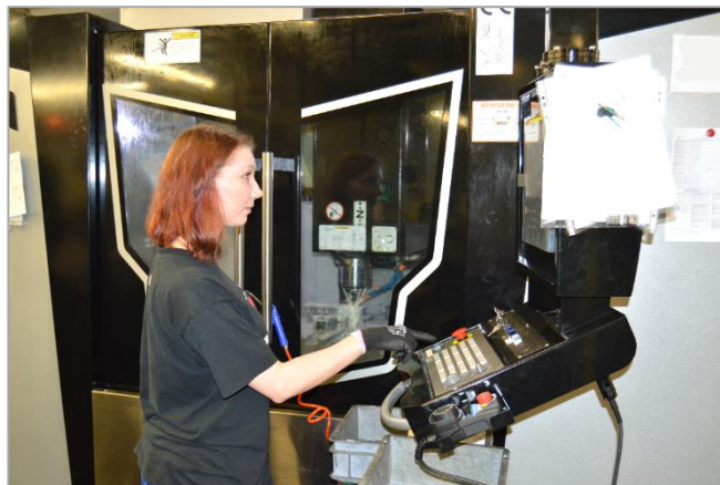
Moderná fréza VMC 1000 obsluhovaná skúsenými zamestnancami spoločnosti Global Industrial Parts, s.r.o.