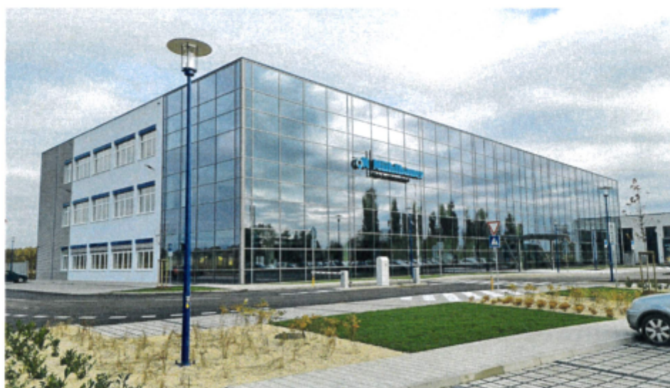
Obrázok 1 Mühlbauer Automation s.r.o., Nitra