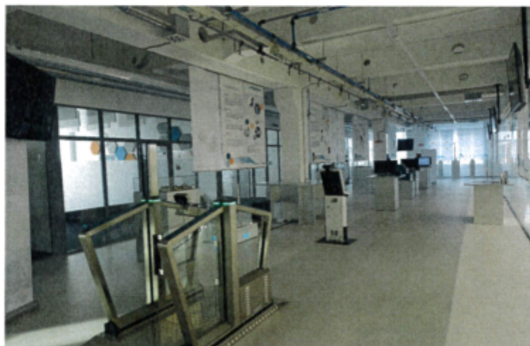
Obrázok 2 : Demo room – Prezentačná miestnosť : „od vytvorenia ID až po hraničnú kontrolu“, Muehlbauer Automation s.r.o. Nitra

Mühlbauer RFID inlay systémy zahŕňajú všetky aplikácie ePassport a smart kariet, či už ide o formát ID-1, či ID-3 alebo aplikácie pre hybridné karty, karty s dvomi rozhraniami alebo bezkontaktné karty. Firma Mühlbauer ponúka so svojou sériou MTT strojov komplexné riešenie pre embedovanie RFID antén. Všetky procesy sú súčasťou jedného modulárneho systému: razenie a implementovanie čipov, ultrazvukové embedovanie antén, zváranie čipov termokompresiou, takisto ako aj testovanie, ktoré zahŕňa aj označenie chybných jednotky. Inlay systém je základným komponentom pre výrobu smart kariet. Celosvetovo už bolo doručených viac ako 100 inlay systémov.