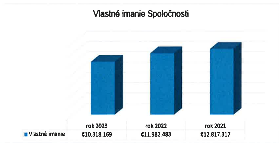
Graf č. 2: Vývoj vlastného imania Spoločnosti za obdobie rokov 2021 – 2023