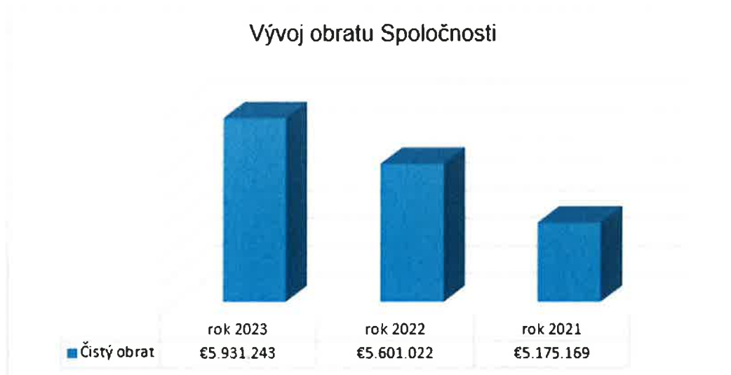
Graf č. 3: Vývoj obratu Spoločnosti za obdobie rokov 2021 – 2023

Údaje uvedené za jednotlivé obdobia vychádzajú z údajov uvedených v účtovných výkazoch (v stĺpci bežné účtovné obdobie), ktoré boli súčasťou účtovných závierok auditovaných k 31.12.2023, 31.12.2022 a 31.12.2021.