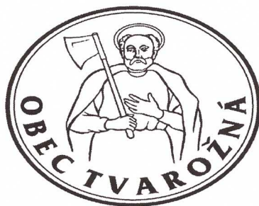
OBR. Č. 4: PEČAŤ OBCE TVAROŽNÁ

V pečati sa vyskytuje horná časť postavy svätého Mateja odetého v plášti, s gloriolou okolo hlavy, ako drží v pravej ruke sekeru opretú o plece.