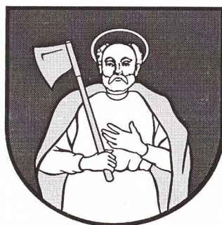
Obr. č. 2: Erb obce Tvarožná

Svätý Matej apoštol je patrónom farského rímskokatolíckeho kostola.