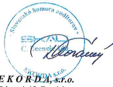
E K O R D A, s.r.o. Révová 45, Bratislava Licencia SKAU 143