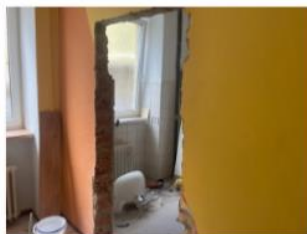
vstup inv wc