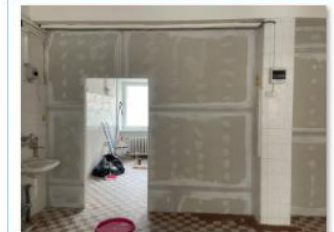
oddych miest _ kuchyňa