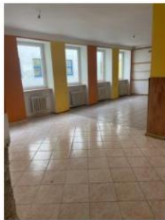
Denná miestnosť _