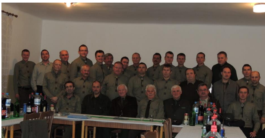
Obr. č. 9