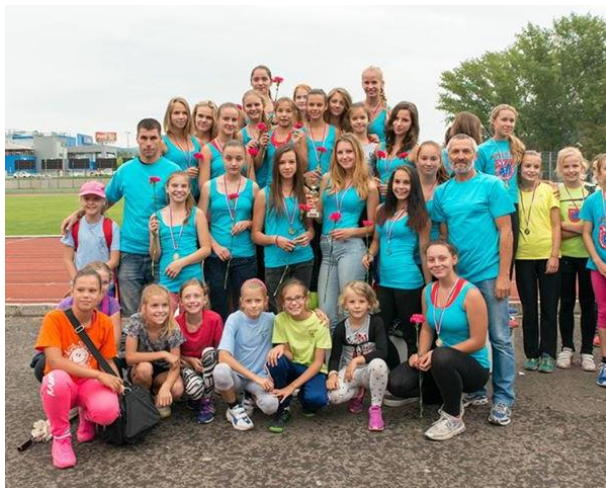
Obr. č. 8

Klub má aj stránku na facebooku: https://www.facebook.com/akbojnicky/