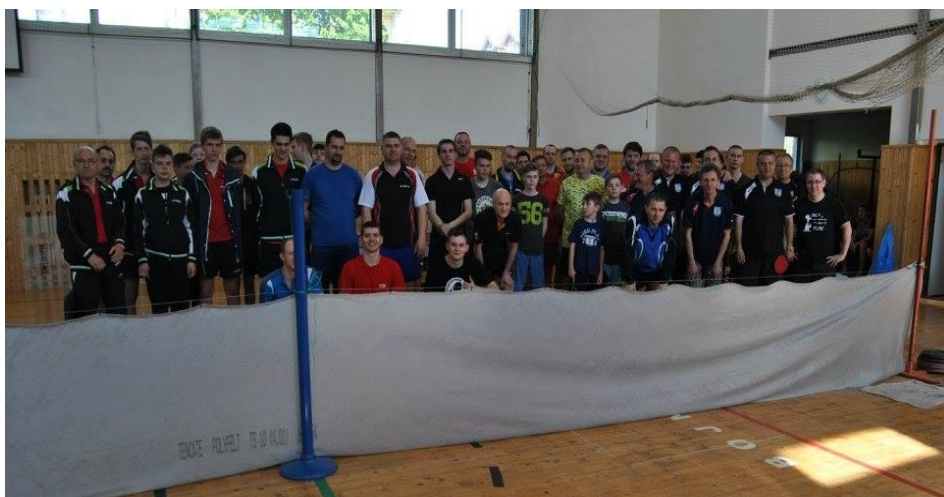
Obr. č. 10