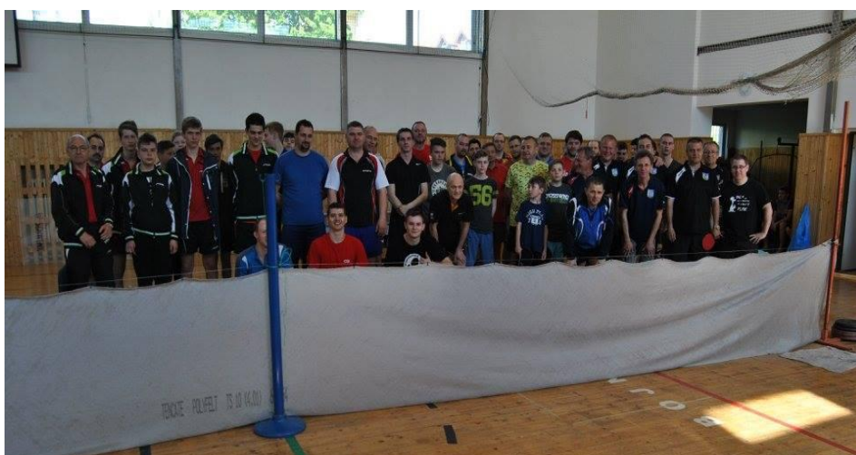
Obr. č. 11