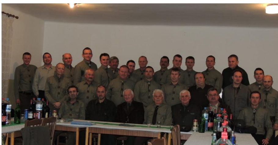
Obr. č. 10