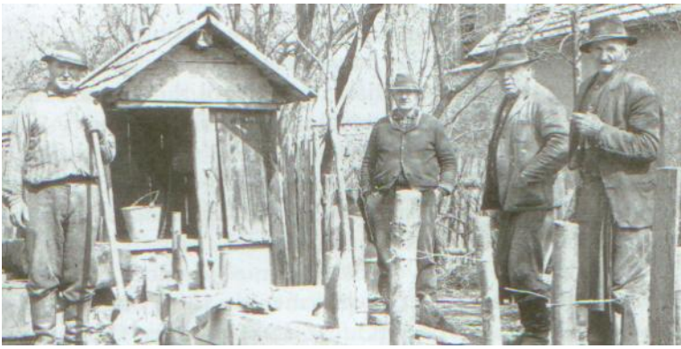
Muži z Kocel'oviec v pracovnom oblečení