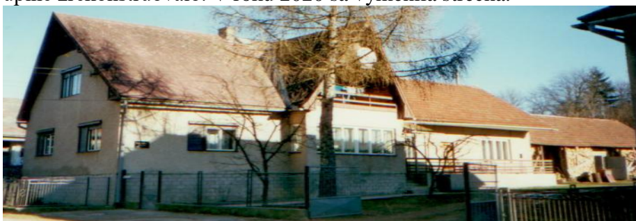
Budova novej fary