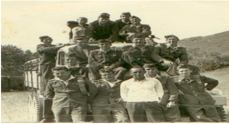
Dobrovoľný hasičský zbor z roku 1959