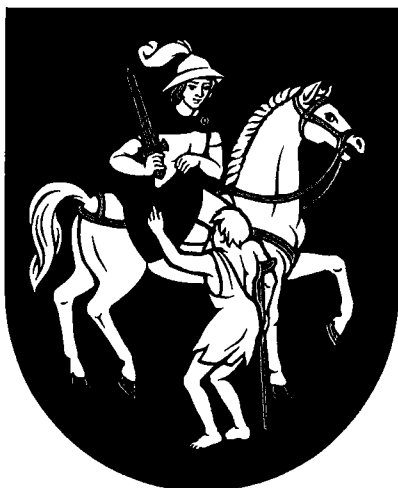
Erb obce Letniče