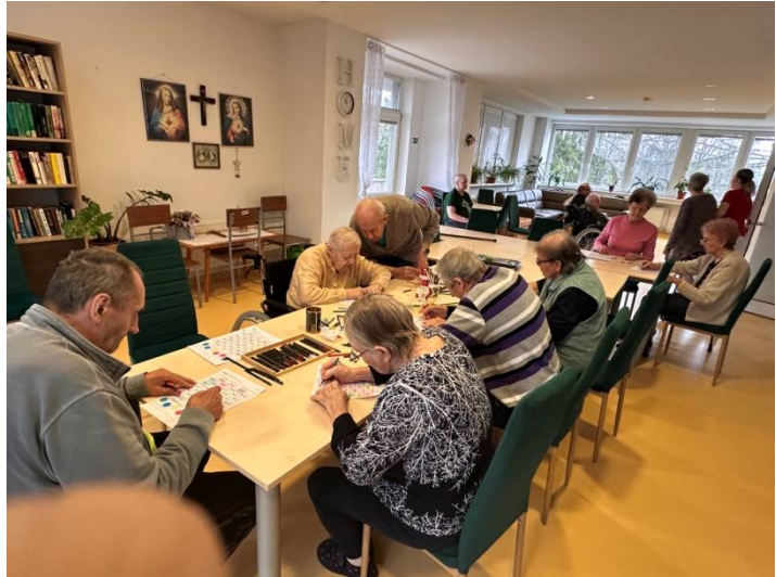
Nácvik jemnej motoriky: vyfarbovanie