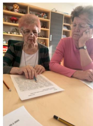
Precvičovanie pamäte: čítanie, počítanie, lúštenie.