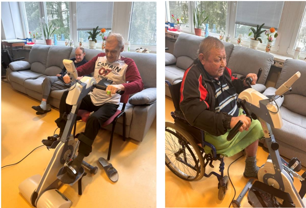
Cvičenie horných a dolných končatín na liečebnom pohybovom stroji

V rámci zlepšenia pohybového aparátu a dobrej nálady realizujeme 3x týždenne pohybové skupinové cvičenia. Prijímatelia radi precvičujú s pomôckami napríklad ako penové loptičky, lopty, ľahké činky, fit gumy.