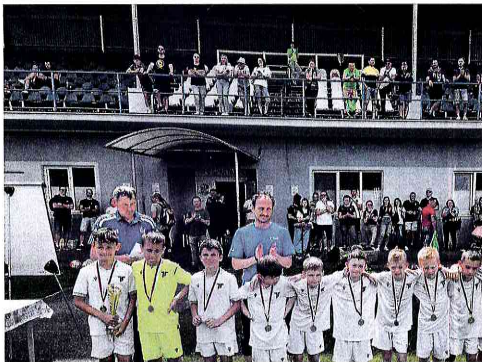
Partizánske – 26. 05. 2024 - Závěrečný turnaj kategorie U 11