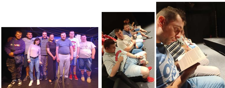
Divadelná hra "Svet podľa Hany" v divadle Viola

Vďaka finančnému daru od Bidfood Slovakia sme sa mohli zúčastniť celodenného poznávacieho zájazdu s cestovnou kanceláriou Ezotour v ZOO Nyíregyháza. Vidieť všetky svetové kontinenty a život zvierat na nich stál určite za to! Fantastický obed aj osvieženie nám pomohlo zdoľať 30 hektárový pozemok 😊😊😊