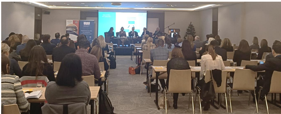
Obrázok 2 „15. medzinárodná konferencia AML & Compliance“, 9.12.2024

Dňa 9.12.2024 zorganizoval IBV NBS, n.o. v spolupráci s BACEE (Banking Association for Central and Eastern Europe) medzinárodnú konferenciu: “15 th International AML & Compliance Conference“ .