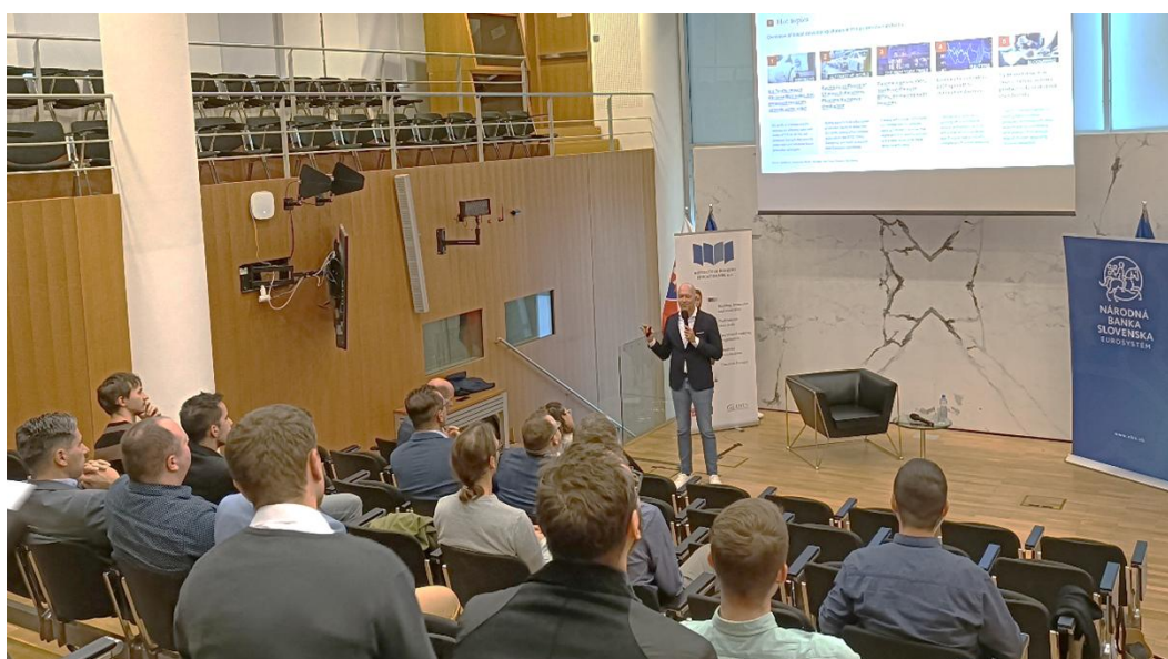
Obrázok 5 „MEGATRENDS Talks: The Future of Automotive“, 9.10.2024

Na prednáškach MEGATRENDS Talks sa v roku 2024 zúčastnilo 75 účastníkov, ktorí na škále od 0 (najhoršie) do 10 (najlepšie) hodnotili jednoduchosť registrácie na podujatie známku 9,5 a organizácie podujatí známku 9,4.