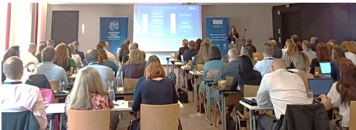
Obrázok 1 Konferencia „ANTI-MONEY LAUNDERING: čo prináša nová AML/CFT legislatíva?“, 29.10.2024

Na škále od 0 (najhoršie) do 10 (najlepšie) účastníci hodnotili: