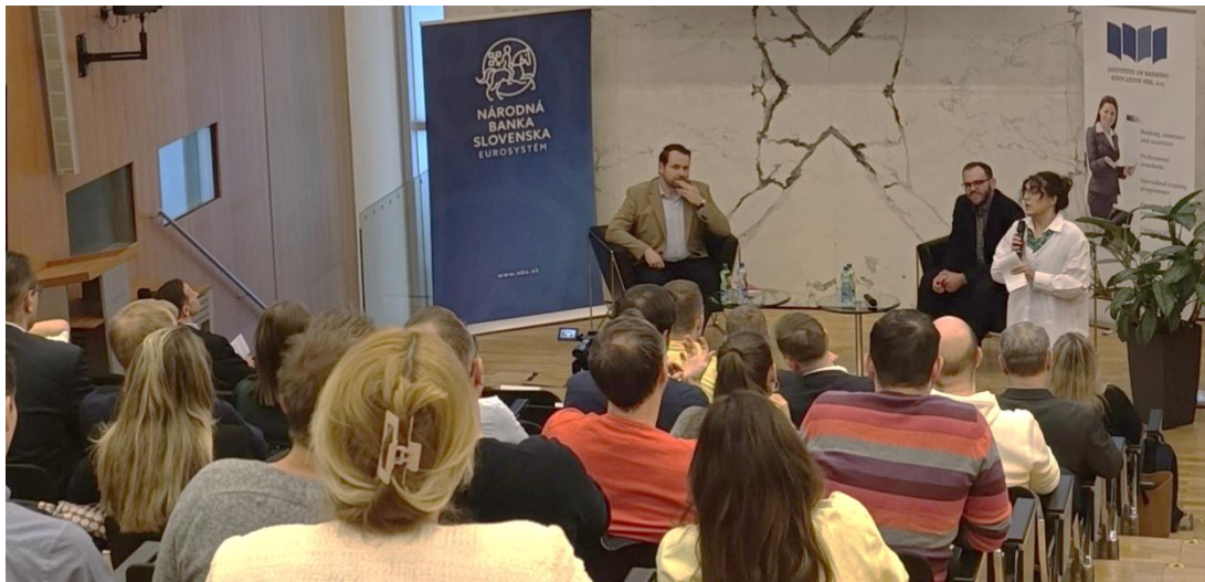
Obrázok 3 „MEGATRENDS Talks: The Future of Work“, 25.04.2024