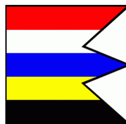
Vlajka obce :