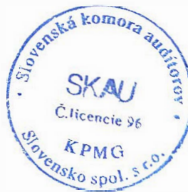
Zodpovedný audítor: Ing. Ľuboš Vančo Licencia SKAU č. 745

Audítorská spoločnosť: KPMG Slovensko spol. s r.o. Licencia SKAU č. 96