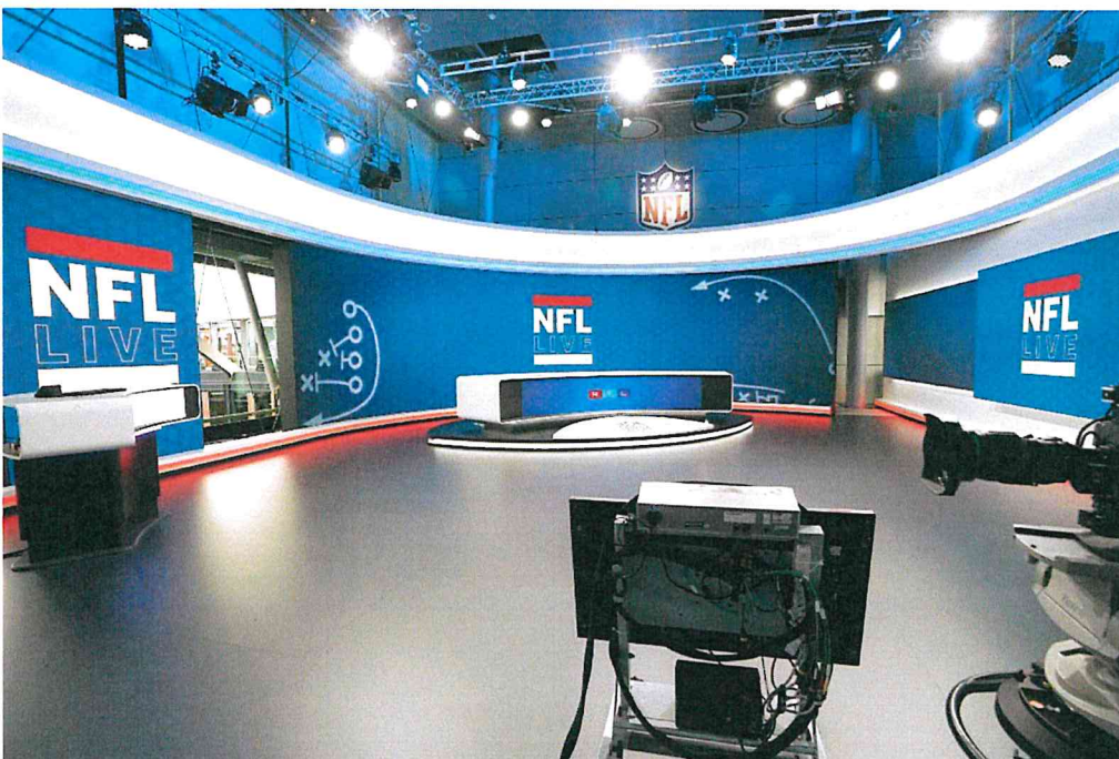
RTL Deutschland NFL broadcast studio, Cologne, Germany Produkty: AT 1.5, TVF 1.2, LPO 7.8, CLI 1.3 Flex Výmera obrazoviek: 72.25 m 2

LEYARD EUROPE s.r.o. LEYARD GERMANY GmbH PLANAR ITALY S.R.L. www.leyardeurope.eu