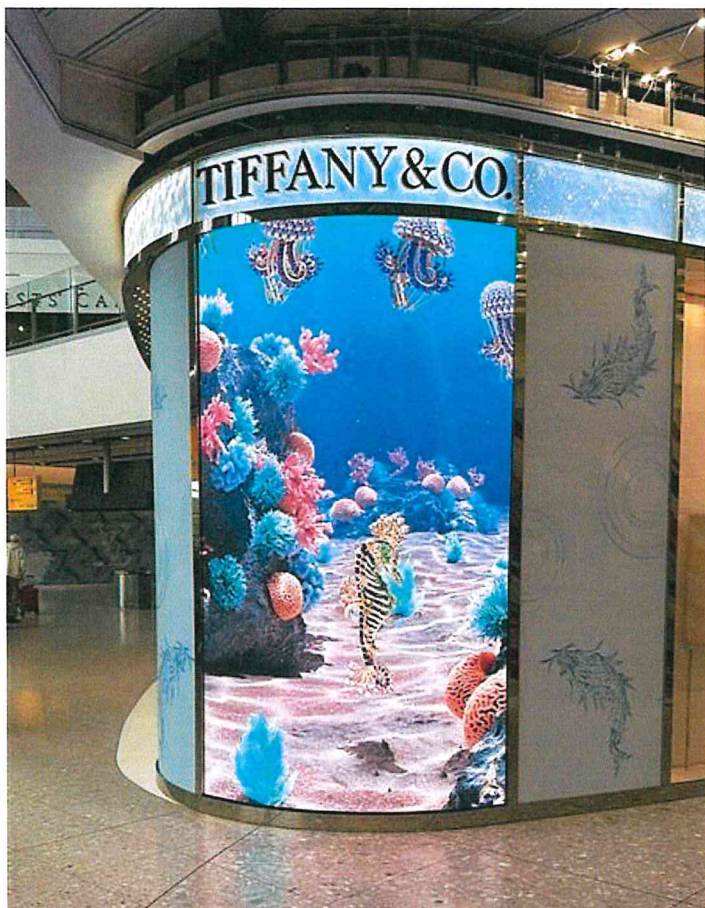
Tiffany & Co, Heathrow Airport, UK Produkty: CL 2.6 Flex Výmera obrazoviek: 18.56 m2

Počas roku 2023 skupina realizovala projekty v zahraničí zamerané na rôzne vertikálne trhy.