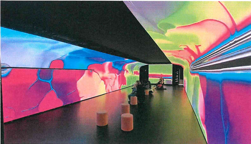
Art Explora – A unique museum-boat, Nice, France Produkty: CL 1.5, CLI 1.5 Flex, LU 1.9 Výmera obrazoviek: 123.5 m 2