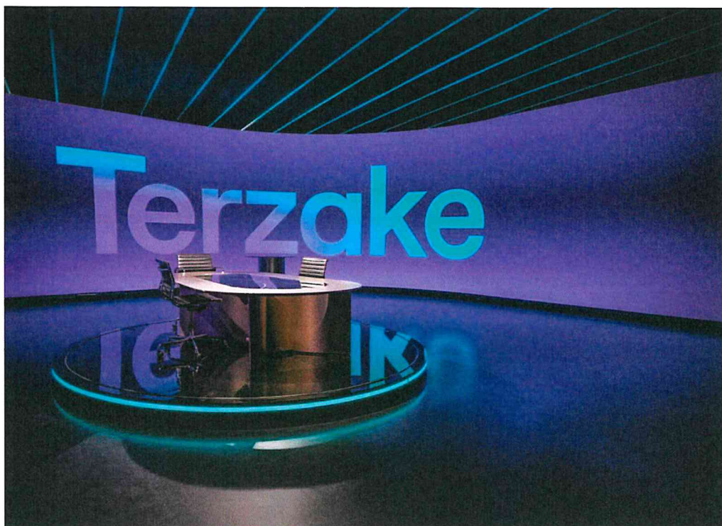
VRT Multifunctional Studio, Brussels, Belgium Produkty: VEM 1.8 Výmera obrazovky: 127.53 m2

LEYARD EUROPE s.r.o. LEYARD GERMANY GmbH PLANAR ITALY S.R.L. www.leyardeurope.eu