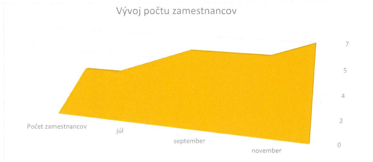
Graf č. 1 : Vývoj počtu zamestnancov v roku 2024

Príspevky boli r. s. p. priznané na základe percentuálneho rozdelenia podľa druhu znevýhodnenia.